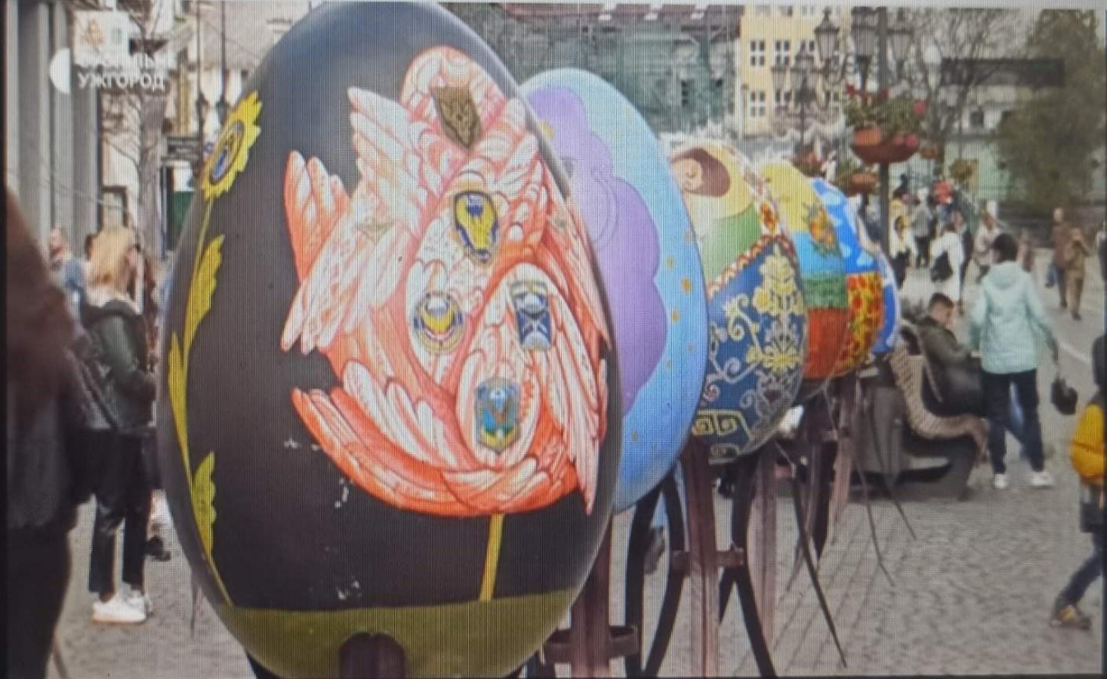
20 писанок-малюванок в Ужгород привезли з Київської області. На площі Петєфі їх розмістили